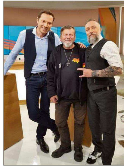
Ne manquez pas « Les Harley du Cœur », demain à 10h50 sur France 3 région.

Une journée, deux ambiances. Tout d'abord, « l'American spirit », avec une expo moto, auto et trucks et une