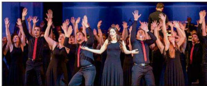
« PZM Jossip Kaplan » à Belvédère le 27 avril.

Les chœurs du Mercantour accueillent le Chœur mixte Croate PZM Jossip Kaplan de la ville de Ryeka en Croatie pour un concert de haut niveau. C'est un ensemble de jeunes choristes issus de l'opéra et du conservatoire national. Lauréats de plusieurs concours internationaux, ils interprètent